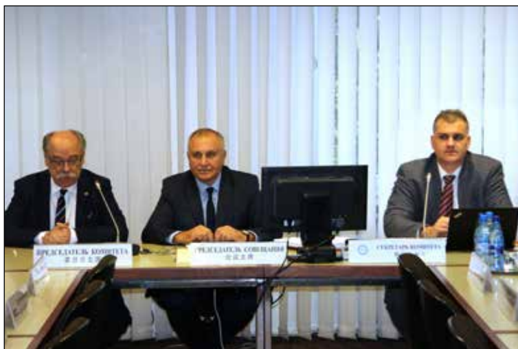
Президиум итогового совещания Комиссии ОСЖД по пассажирским перевозкам (24-26.10.2023, Комитет ОСЖД, в гибридном формате)