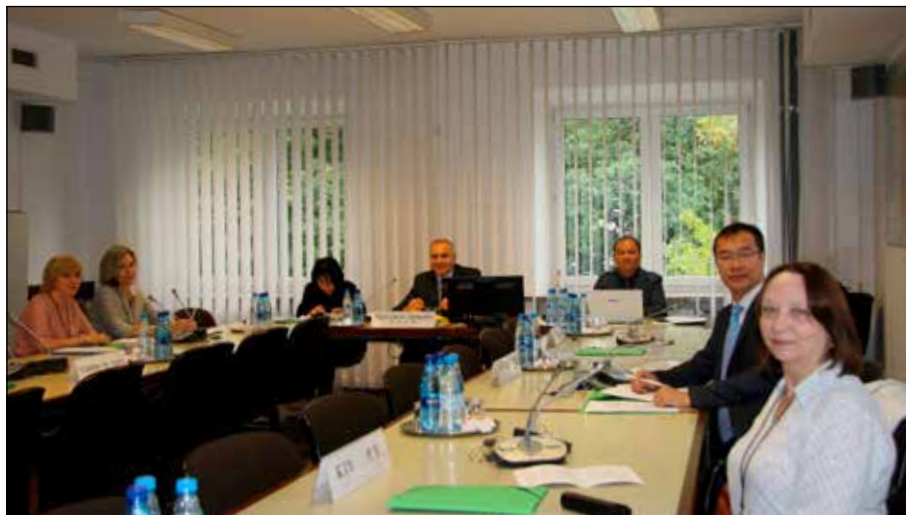
Совещание экспертов железных дорог ОСЖД по теме «Системы резервирования мест, справочно-информационного обслуживания пассажиров, предоставления услуг и формирования финансовой отчётности» (26-27.09.2023, Комитет ОСЖД)

произведённым поездкам. В случае необходимости подтверждения факта проезда (в части командировок, возмещения расходов, судебных разбирательств и пр.) владельцы электронных билетов после регистрации посадки проводником поезда могут в личном кабинете в течение 30 дней после совершения поездки получить посадочный талон к своему электронному билету.