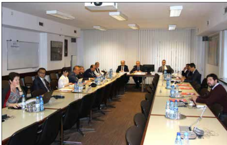
Итоговое совещание Комиссии ОСЖД по пассажирским перевозкам (24-26.10.2023, Комитет ОСЖД, в гибридном формате)