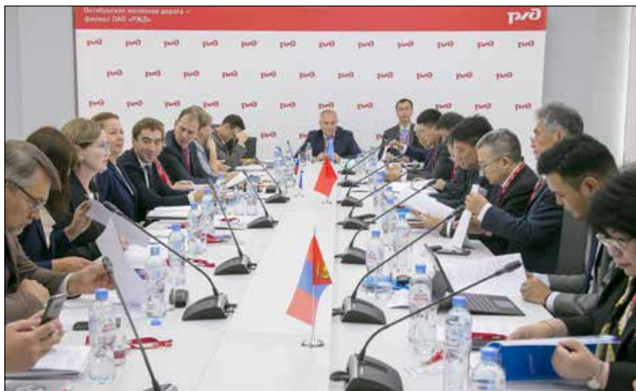
Открытие совещания II группы железных дорог ОСЖД по разработке и согласованию расписаний движения пассажирских поездов, схем формирования составов поездов и предоставления в них вагонов в международном сообщении на 2023-2024 гг. (11-15.09.2023, г. Санкт-Петербург, Россия)

По информации Белорусской железной дороги , в настоящее время на дороге обеспечивается возможность оформления билетными кассирами проездных документов (билетов) на поезда межрегиональных линий и региональных линий бизнес-класса (с нумерованными местами) с использованием стационарных билетопечатающих машин. С сентября 2023 года также введено в опытную эксплуатацию модернизированное программное обеспечение (ПО) портативных билетопечатающих машин в части оформления начальниками поездов проездных документов (билетов) пассажирам. При этом проездные