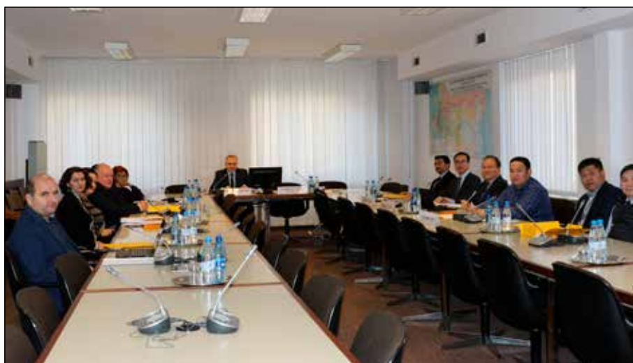
Совещание экспертов железных дорог ОСЖД по теме «Системы резервирования мест, справочно-информационного обслуживания пассажиров, предоставления услуг и формирования финансовой отчётности» (28.02-01.03.2023, Комитет ОСЖД)

По многочисленным просьбам от пассажиров на официальном сайте bilet.railways.kz , а также в мобильном приложении, реализована возможность получения посадочного талона по